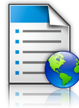
Формы и Избранное

Решения серии вместе с инструментами управления парком устройств Lexmark и программным обеспечением и технической инфраструктурой вашей компании формирует экосистему МФУ от Lexmark. Адаптивность системы полностью оправдывает ваши инвестиции в технологию Lexmark.